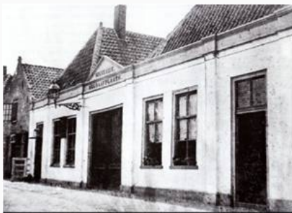
Entree begraafplaats (ca. 1900)

gerenoveerde park een bezoek zeker waard maken. Het boekje is opgedragen aan Wout, omdat hij de publicatie helaas niet meer heeft mogen meemaken. Het is voor € 9,50 te koop bij de boekhandel.