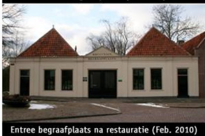
Entree begraafplaats na restauratie (Feb. 2010)