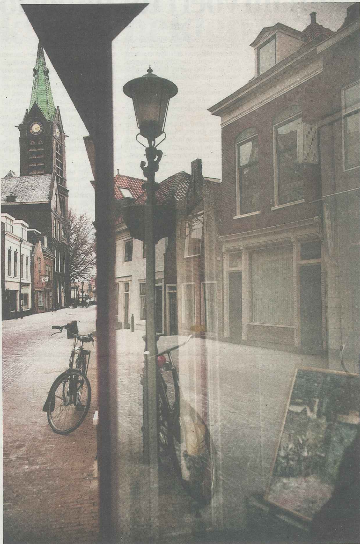
De Hoogstraat, aangelegd op een dijklichaam. Foto's linksboven: een van de vele steegjes in het oude centrum. Midden: de Pelmolen aan de Westhavenkade, nu een appartementencomplex.