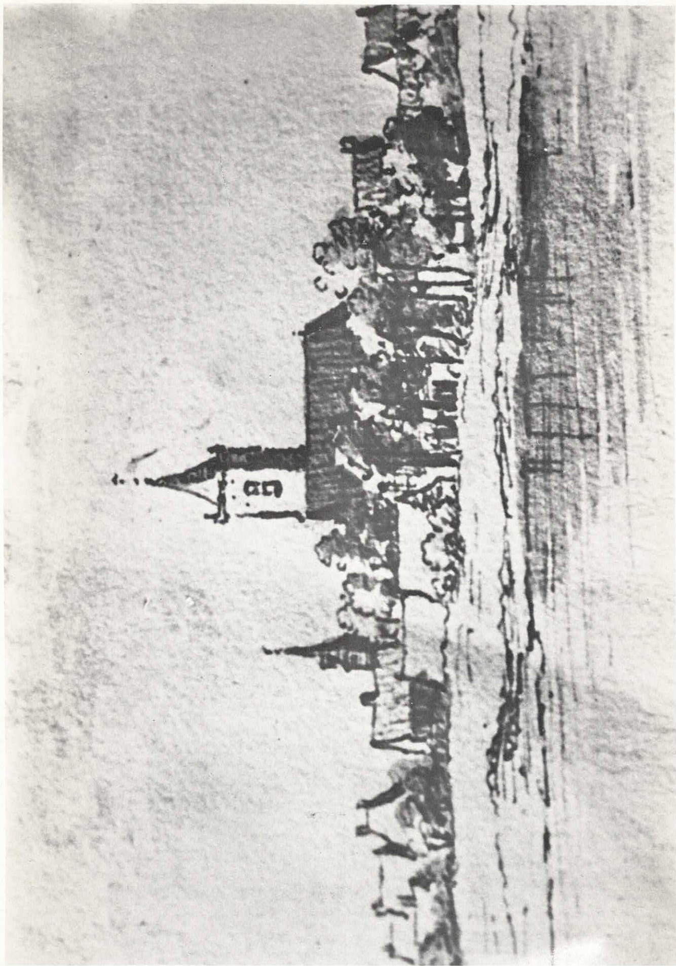
Vlaardingen vanaf de Maas, 1673