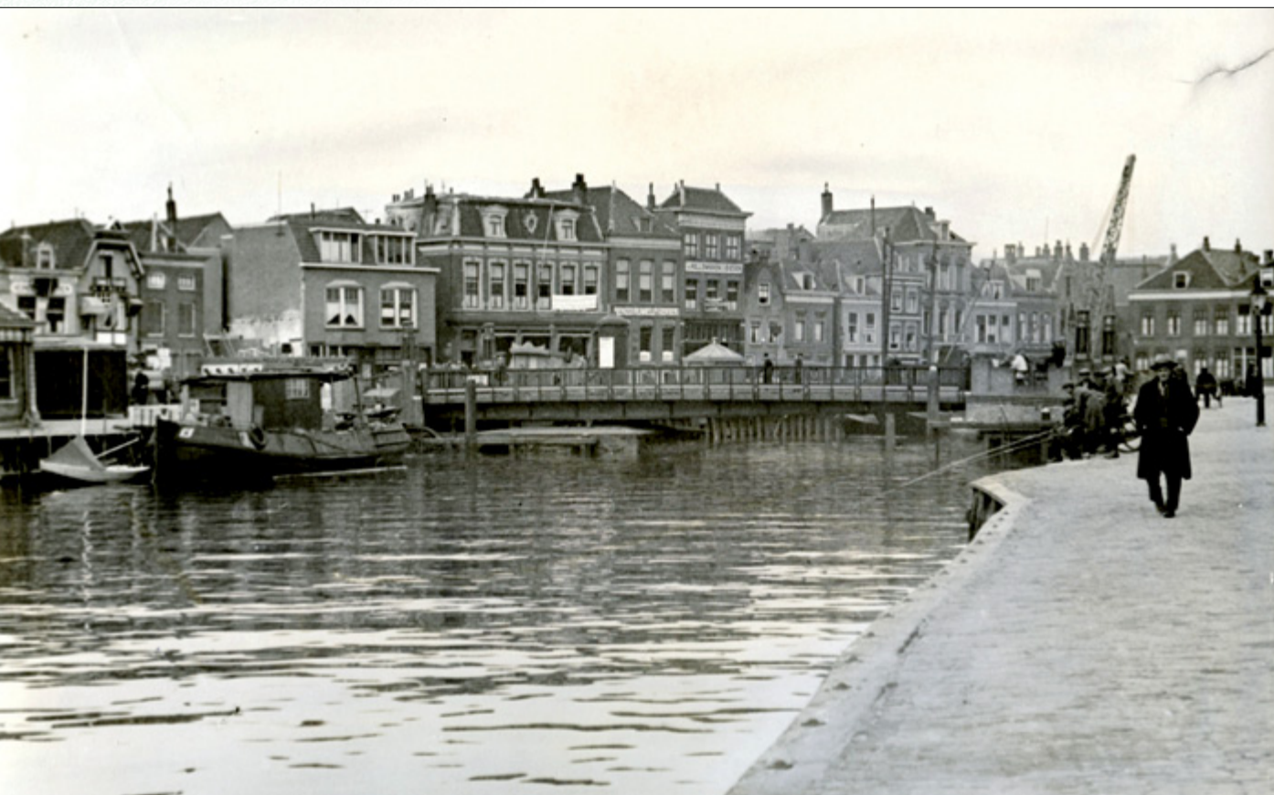
De hekken van de brug bleven gesloten om de mensen te beletten naar de Schiedamseweg te gaan.