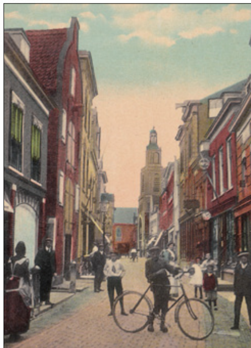
Vlaardingen moet weer een echte historische stad worden.... Ansichtkaart van de Hoogstraat omstreeks 1900. (Collectie HVV).

“Kennisoverdracht zal een sleutelwoord zijn voor de toekomst” vertelde ik tijdens de ALV van 2010. En daar hebben we het afgelopen jaar veel tijd in gestoken en dat zal zeker voortgezet worden. Ook vanuit de gemeente vinden we elkaar steeds meer, wat niet betekent dat