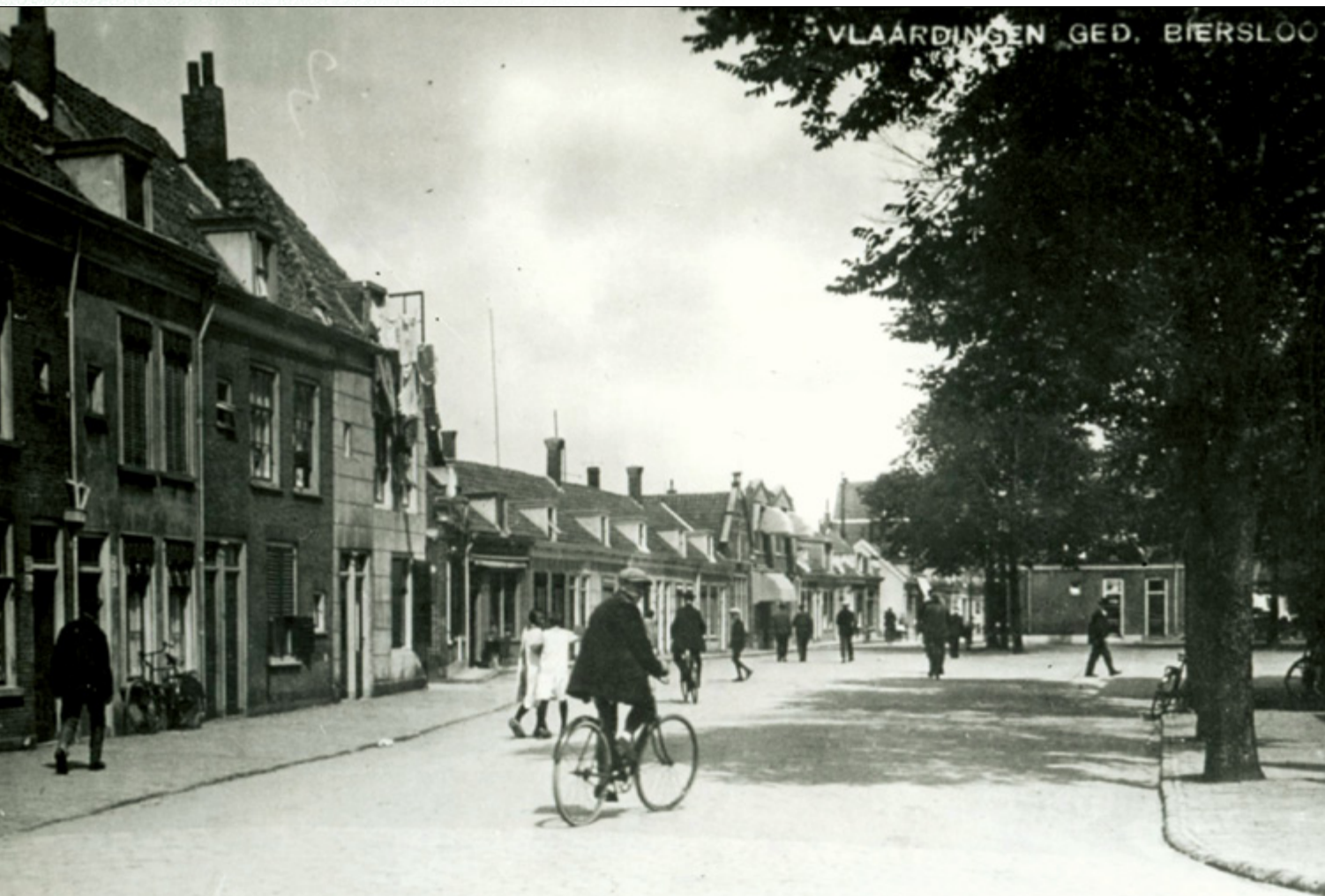
Het Veerplein werd met veel geweld ontruimd.

Het was bekend dat donderdagsavonds op het Veerplein een meeting zou plaatsvinden. De burgemeester had met de commissaris afgesproken, geen machtsvertoon te houden en er daarom slechts één agent te plaatsen, die zou waarschuwen. “Waar de orde door een deel van de bevolking was verstoord, daar had de politie te zorgen dat de orde werd hersteld”, zo besloot de burgemeester zijn betoog.