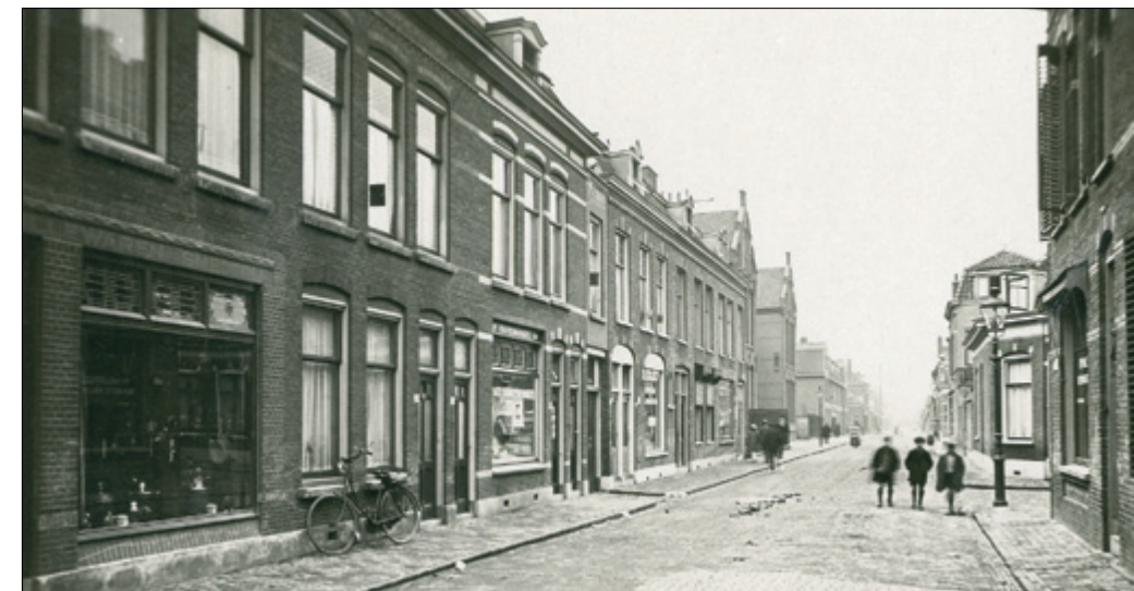
De Oosterstraat in 1930. Geheel links de smederij en winkel van Koning.

Er werd getrouwd op een zonnige woensdag in mei. Tranen van ontroering gleden over mijn houten wangen toen daar het bruidje de kamer binnenkwam. Het tere wit van haar japon, het kokette kapje op haar donkere