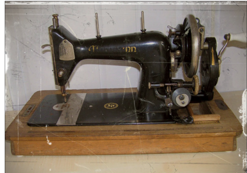
De oude Naumann naaimachine heb ik heel wat jaren moeten dragen.