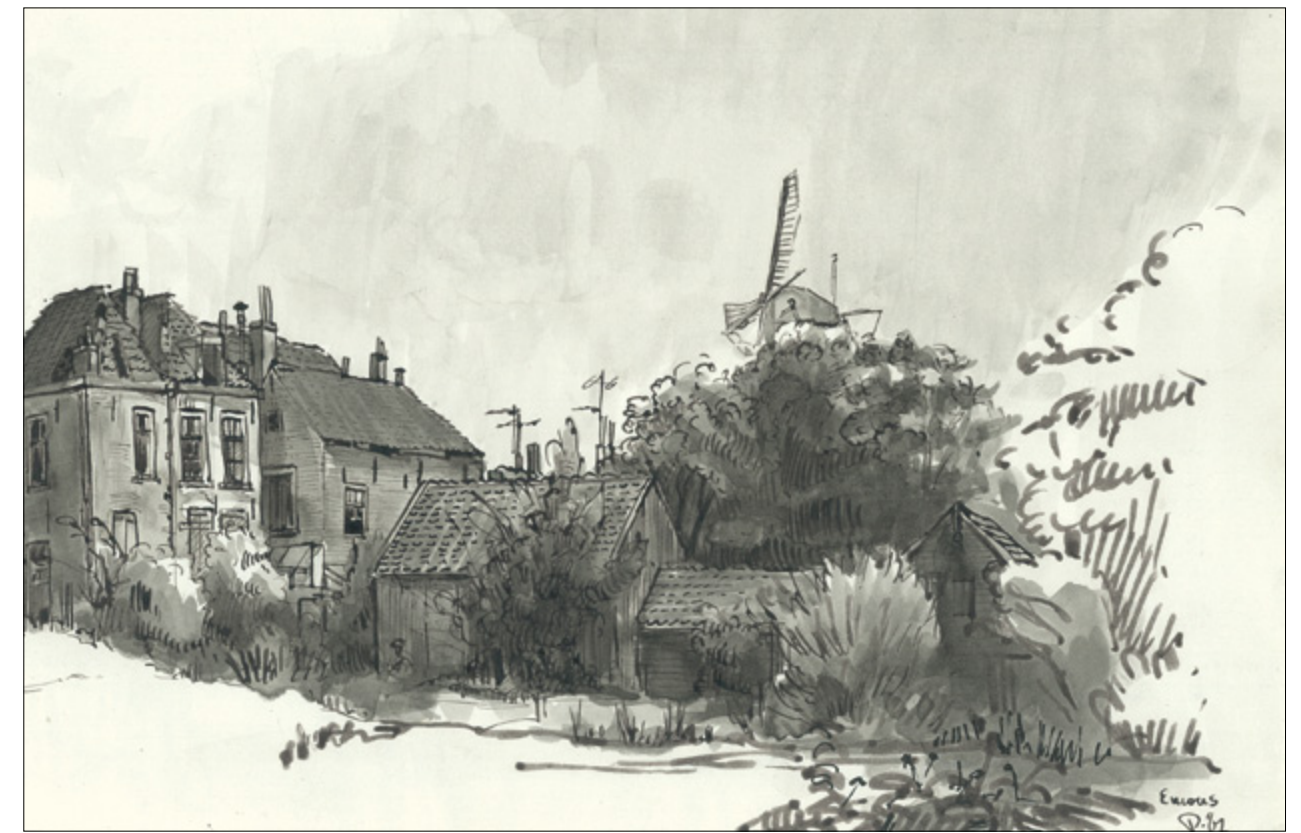
De achterkant van het Emaus. Hier heeft de R.K. schuilkerk bestaan.

Tegen het eind van het priesterschap van Dijkman, op 5 februari 1777, verzochten de kerkmeesters van de Rooms- Katholieke Kerk van Vlaardingen en Zouteveen de Gecommit-