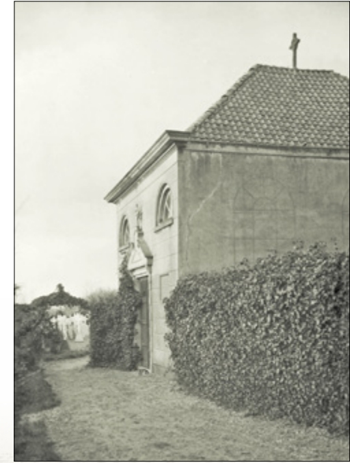
De kapel van de R.K. begraafplaats aan het Emous te Vlaardinger-Ambacht, afgebroken in januari 1931. (P.D. de Vries, 2-1-1931, collectie Stadsarchief Vlaardingen)

weg (Emous), naast het rooms-katholieke deel van de huidige begraafplaats. Het nieuwe kerkgebouw zou, behalve het hannekenhok en een drietal kamertjes (mogelijk ruimten waar de trekarbeiders de diensten konden bijwonen), binnenmuurs 80 voet lang (ruim 25m), 33 voet breed (ca.10,4 m) en hoog eveneens 33 voet (van de vloer tot de nok) worden. In de zijmuur zaten zes kruiskoziijnen voorzien van "gemene glazen in het loot geset" met draaiende onderversters, tussen gemetselde staanders van 19 voet (5,9 m) hoog en op het dak lagen gewone rode dakpannen, overeenkomstig bijgevoegde "seekere kaart figuratief". Daaruit blijkt dat de lengte over alles 100 voet (31,5 m) bedroeg. Alles was conform het plakkaat van 21 september 1730 waarbij voorgeschreven werd dat een schuilkerk er niet als kerk of publiek gebouw mocht uitzien en voor gebruik door de Gecommitteerde Raden gekeurd moest worden. Het verzoekschrift ging