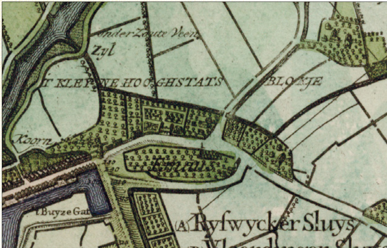
Het Emous en omgeving op de kaart van Kruikius (1712).

bouwwerkje was inclusief het portaal 48 voet lang, 23,5 voet breed (zo'n 14,1 bij 7,40 m), de zijmuren 3,8 m hoog en kon al sinds lange tijd onvoldoende ruimte bieden aan de gelovigen. Dit vooral als er seizoenwerkers van buiten aanwezig waren. Deze aanwas van trekarbeiders deed de kerkdiensten vaak naar buiten verhuizen. Volgens klachten van "er nabijwonenden opgeseetenen, wesende van de gereformeerde Religie" bleek dit niets dan ergernis voort te brengen, ook voor de rooms-katholieken zelf. Vandaar het voorstel en verzoek, via tussenkomst van de baljuw van Zouteveen, aan de Gecommitteerde Raden om een vergroting van het gebouw in de lengte van 18 voet (5,65 m), tegelijk met het noodzakelijke reparatiewerk aan dak en vloer, en het bijtrekken van een stuk land, dat voor het oude gebouw lag. Breedte en hoogte