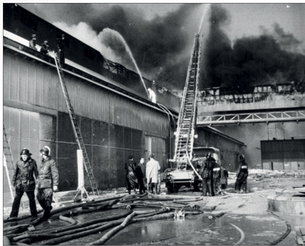
Brand bij de ENCK in 1963.

Twee iconen op één beeld: het wagenveer en het Delta Hotel uit: Van 't Oft naar 't Oofdl 32. Delta Hotel, schouwburg van de wereldscheepvaart.