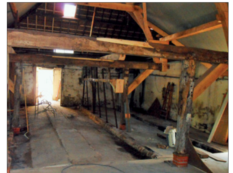
De gebinten van de stal.

Boerderij Zonnehoeve ( Trekkade 24 geopend van 11.00 tot 16.00 uur)