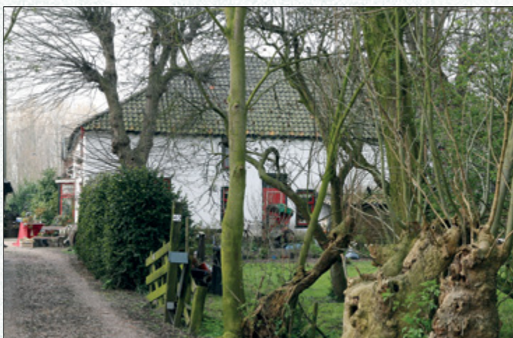
De Wijnboerderij, Zuidbuurt 40.