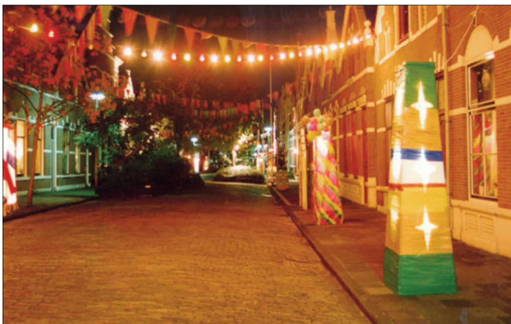
In 1990 vierde de straat het 100-jarig bestaan. De straat was toen voorzien van feestelijke kunstwerken.