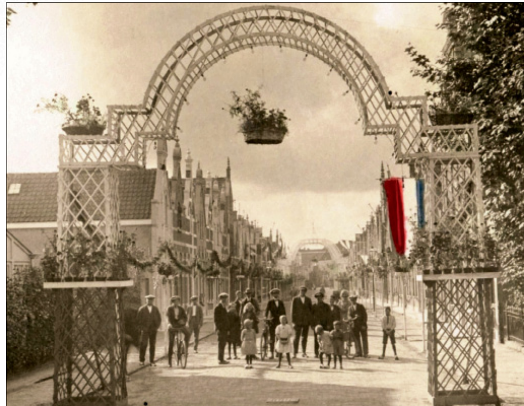
Een ereboog ter hoogte van nr. 14, 1924.

Het waren verschillen, maar toch kon de een niet zonder de ander, in welke bedrijfstak dan ook. En vaak was er op de een of andere wijze ook wel een familieband in de straat. Dat men samen optrok was bijvoorbeeld merkbaar als er stadsfeesten waren. Zo bracht in 1924 koningin Wilhelmina een bezoek aan Vlaardingen en dat moest natuurlijk groots gevierd worden. Ook de Arnold Hoogvlietstraat bleef daarin niet achter en er werd een buurtvereniging opgericht. Gelden werden ingezameld en de straat werd uitbundig versierd met een ereboog en feestelijke zuilen, net zoals in 2015.