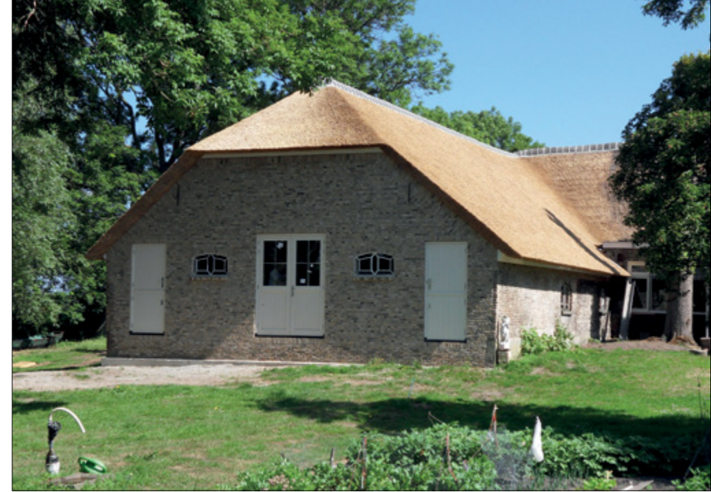
De gerestaureerde stal van boerderij Zonnehoeve.