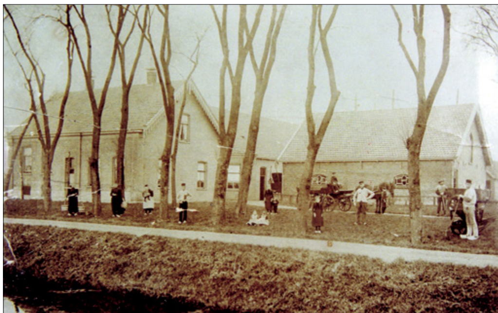
Toen de Engelenhoeve (Zuidbuurt 89) nog als boerderij in gebruik was...

Als men achter de Freegolfbaan richting de