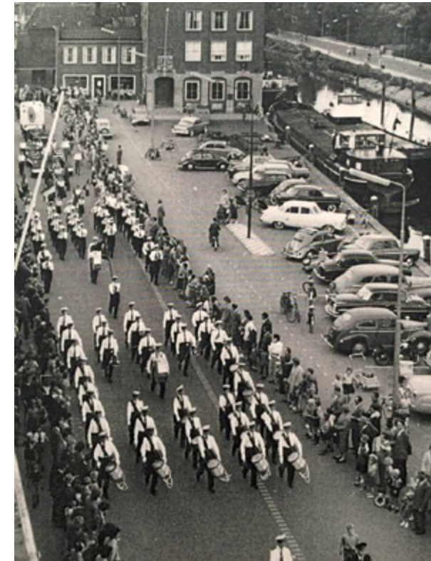
Onder grote belangstelling marcheren de Pijpers over de Westhavenplaats.

ventielen, die voorzien waren van een rood-geel-blauwe vlag en een lang wit koord over de schouder, verbonden met de hoorn.