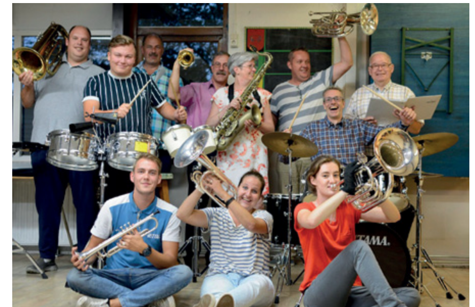
Avalance nu: geen grote fraai geüniformeerde showband, maar een kleine, maar vrolijke stageband.

Een chronisch probleem van de laatste jaren is de daling van het aantal leden, waardoor Jong Avalance sinds enkele jaren helaas niet meer bestaat. Voor Avalance leidde die daling van het aantal leden enkele jaren geleden bijna tot