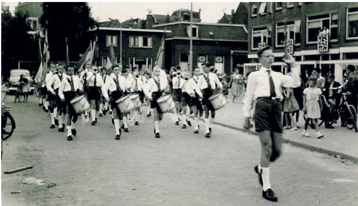
De Jonge Pijpers in de Fransenstraat, 1960.