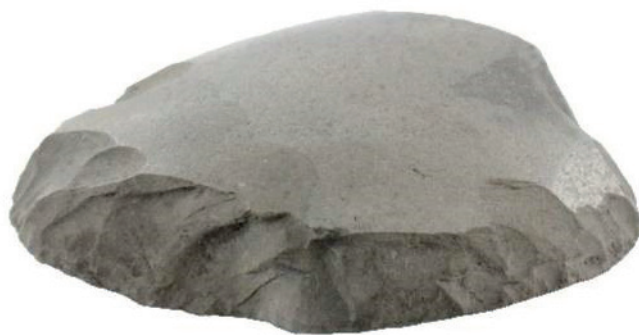
Vuurstenen schrabber van de Vlaardingencultuur. Bovenop is de steen mooi gepolijst, en onder is de 'omvorming' tot schrabber zichtbaar (code 07.003-001802; Archeologisch en Bouwhistorisch depot van de gemeente Vlaardingen).