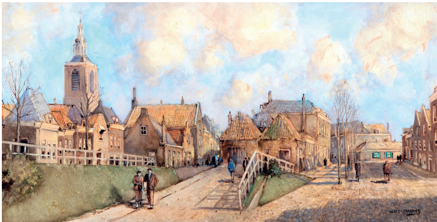
Gezicht op de Zomerstraat en de oprit naar de Maassluisdijk, circa 1950 (Aquarel door Herman Paradijs; Collectie Stadsarchief Vlaardingen PRVL 0742).