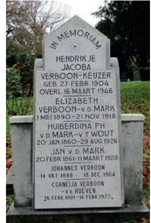
Grafmonumenten voor en na de opknapbeurt, 2022.

kunnen daarbij adviseren. Hieronder een voorbeeld van een verwaarloosd aangetroffen graf en het resultaat van het herstel door de HVV-Werkgroep Emaus.