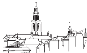
Historische Vereniging Vlaardingen

De wandeling en de puzzeltocht zijn een gezamenlijk initiatief van de gemeente Vlaardingen en de Historische Vereniging. We zien u graag op 10 september!