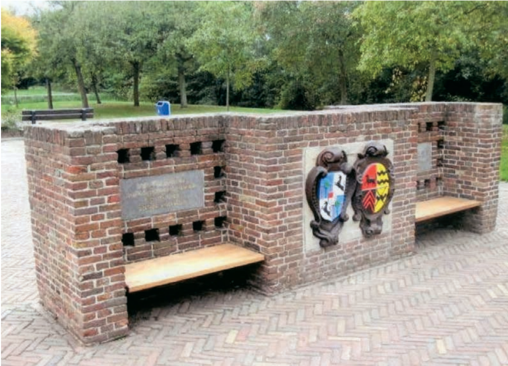
De zitbank met de ingemetselde wapens Basius-Van der Dussen, ca. 2020.

beschreven worden als: “van zilver met een vrijkwartier en beladen met zeven zoomsgewijs geplaatste merletten, alles van keel (keel is in de heraldiek de kleur rood).”