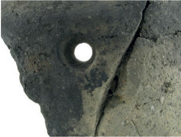
Detail van scherf van een pot van de Vlaardingencultuur. Het gat is aangebracht om de pot te repareren. (code 07.003-000033; Archeologisch en Bouwhistorisch depot van de gemeente Vlaardingen).