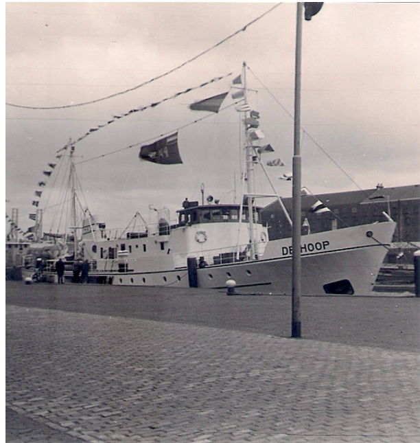
HKS de Hoop op Vlaggetjesdag 1962.

Op 23 januari 2024 gaat onze Vlaardingse visserijkenner Henk Brobbel vertellen over het vroegere Vlaggetjesdag in Vlaardingen. Vlaggetjesdag was een heel groot evenement waarbij de vissersschepen mooi gepavoiseerd