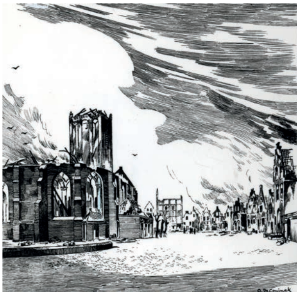
Fantasie-pentekening van de Vlaardingse stadsbrand op 2 juni 1574 (Octave DeConinck; collectie Stadsarchief Vlaardingen).

Schiedam en de Spanjaarden trokken in het najaar van 1574 in de ruïnes van Vlaardingen. De Vlaardingers die nog niet waren gevlucht, vertrokken halsoverkop naar Voorne-Putten, dat nog wel in handen van de Geuzen was. In de zomer van 1575 blijkt het grootste deel van hen weer terug te zijn in zijn vaderstad.