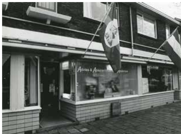
Voorstraat, advies en assurantielokantoor Anderson, foto Roel Dijkstra (collectie Stadsarchief Vlaardingen).

Op Voorstraat 41 zat Van Schaik woninginrichting, hier verkochten ze gordijnen, vloerbedekking enz, met een