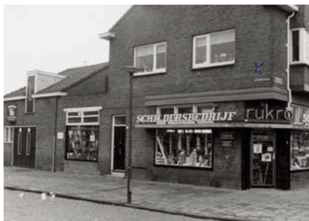
Fa. Rukro, Burgemeester de Bordesplein 9.