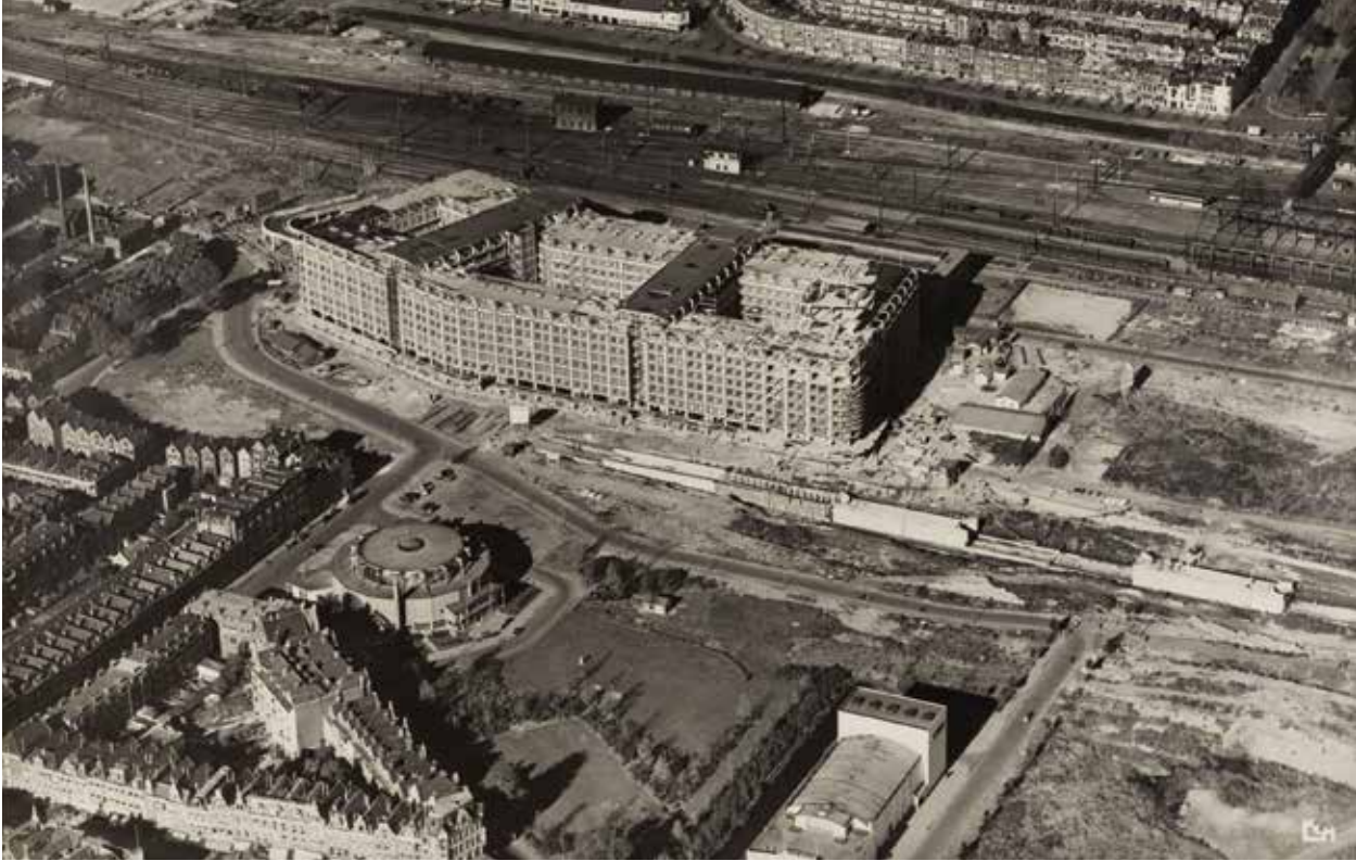
Groothandelsgebouw, Stationsplein 45, Rotterdam (1945-1952). Luchtopname Weena met het gebouw in aanbouw, 1951.