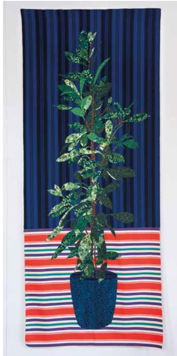
| Norbert, 2024, applicatie op restanten textiel.

In 1996 krijgt Wilma Kuil een opdracht van de gemeente Vlaardingen om, met een beperkt budget, iets te ontwerpen voor twee trappen die in het nieuwe Stadshart een hoger en lager gelegen deel met elkaar zullen verbinden. Omdat Kuil altijd met bloemenmotieven werkt, laat ze zich voor dit ontwerp inspireren door de Spaanse trappen in Rome, die vol staan met echte bloemen. Kuil denkt aan een uitvoering in terrazzo en komt hiervoor in contact met het Vlaardingse bedrijf Tomaello BV. De uitvoering blijkt echter veel duurder dan het door de gemeente beschikbaar gestelde budget. Onder leiding van o.a. oud-burgemeester Fred van Lier en de Vlaardingse ondernemer André Fontijne wordt met succes de Stichting 'Spaanse trappen' opgericht, bedoeld om bij fondsen en het bedrijfsleven middelen te werven voor de realisatie van de 'Bloementrappen Vlaardingen'.