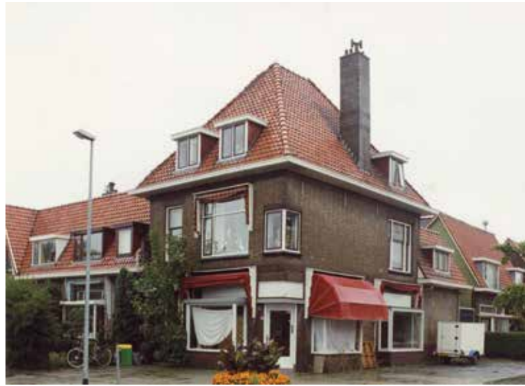
Hoek Burgemeester de Bordesplein en Rozenlaan.