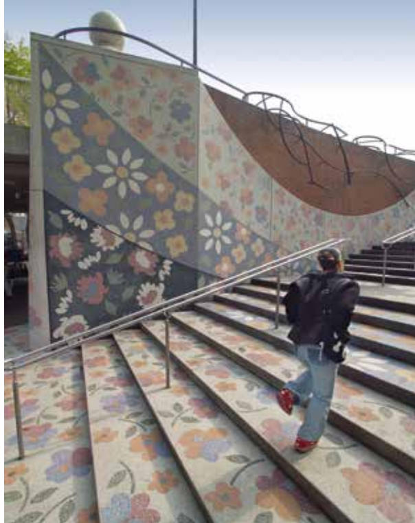
| Bloementrappen Vlaardingen.

De tentoonstelling toont een representatieve selectie uit het omvangrijke oeuvre van Wilma Kuil, met onder andere werken van haar hand uit toonaangevende Nederlandse kunstmusea. De titel Reflecties in Patronen verwijst naar de wijze waarop Wilma haar kijk op de wereld en haar reflectie daarop heeft vormgegeven door bestaande patronen te transformeren in beelden met een eigen zeggingskracht.