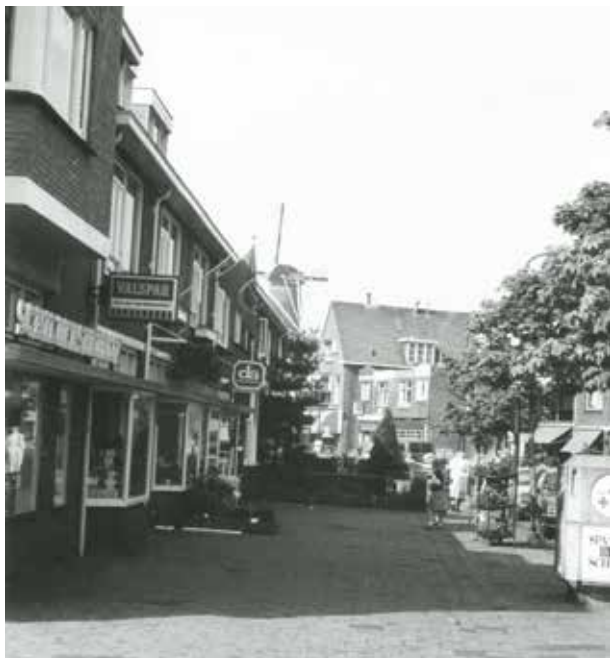
| Burgemeester de Bordesplein.