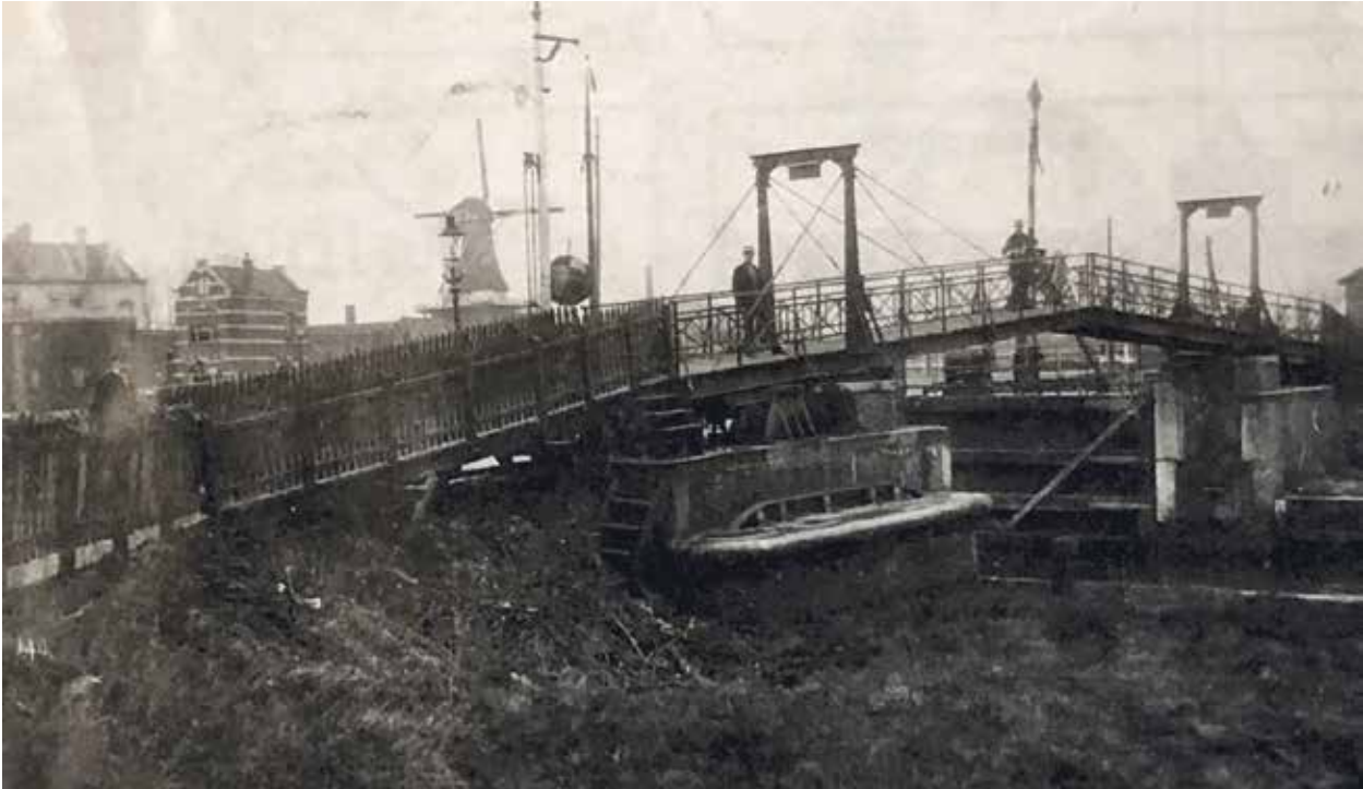
| De 'kippebrug'.

verder langs de Maas een groot grasveld. Moeder ging er, 's woensdagsmiddags, graag eens met ons wandelen. Wij – zusjes – met onze poppenwagen, zij met haar stopwerk om er te genieten van het water, de Maas. Zij kwam van het eiland Ameland: water rondom. Wij bleven voor de Vlaardingers – evenals de Hutters – de 'vreemden'.